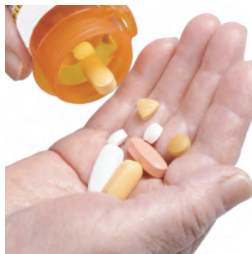
Pregunte a su médico en su farmacia sobre los medicamentos para el síndrome de las piernas inquietas.

En seguida le diremos que es lo que puede hacer para aliviar los síntomas del síndrome de las piernas inquietas (RLS).