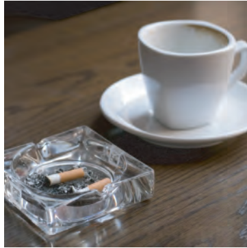
Limite el consumo de alcohol y cafeína.

El síndrome de las piernas inquietas (Restless Legs Syndrome, RLS), puede causar una sensación de picazón, hormigueo o piernas adoloridas, lo que hace que usted quiera mover las piernas. Esto puede causarle molestias para dormir o incluso estar quieto.